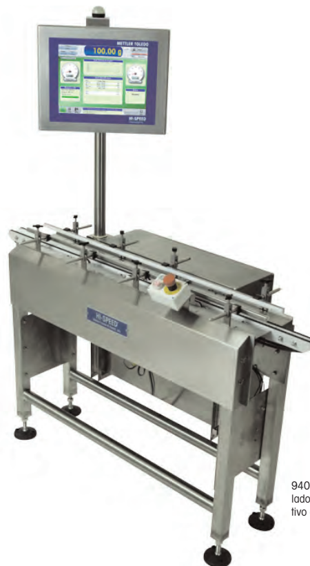
9400 con un controlador XS y un dispositivo de señal opcional.

Las transferencias laterales permiten la integración correcta de la pesadora de verificación junto a las líneas de producto existentes, entregando una transferencia de producto suave dentro y fuera de la línea de producto.