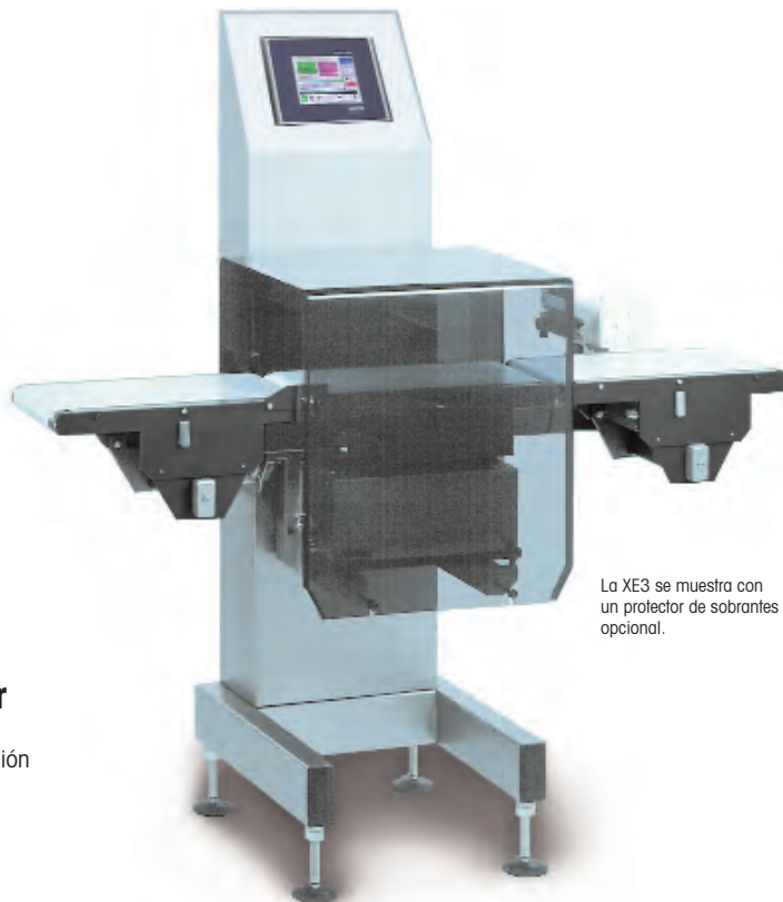
La XE3 se muestra con un protector de sobrantes opcional.