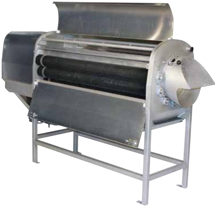
Modelo 2420 con seis rodillos

El modelo 2420 de Vanmark es la más eficiente peladora de su clase. Es ideal para la industria moderna.